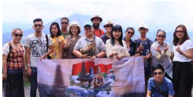
บริษัท ทู คอร์ปอเรชั่น จำกัด (มหาชน) และบริษัท โมโน เทคโนโลยี จำกัด (มหาชน) พาผู้โชคดีที่ร่วมสนุกกับกิจกรรม “โชคดีรับปีใหม่ บินไกลถึงบาห์ลีเที่ยวฟรีกับทรูมูฟ เอช” บินตรงถึงบาห์ลี สัมผัสบรรยากาศและเรื่องราววัฒนธรรม ความเชื่อของคนบาห์ลี พร้อมกิจกรรมต่างๆ มากมาย