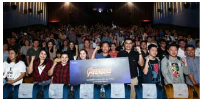
บริษัท เอสซี แอสเสท คอร์ปอเรชั่น จำกัด (มหาชน) จัดกิจกรรม SC Family Movie Day พาครอบครัว SC Family ชมภาพยนตร์เรื่อง AVENGERS : INFINITY WAR โดยภายในงานมีกิจกรรมที่เสริมสร้างความสัมพันธ์ที่ดีระหว่างเพื่อนบ้านตามแนวคิด Lively Neighbourhood