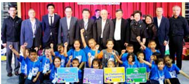
กลุ่มบริษัทบีทีเอส จัดงาน ‘ค่ายสถานี ส่งความสุขจากชาวบีทีเอส กรุ๊ปฯ’ ครั้งที่ 2 โดยนำนักเรียนจากต่างจังหวัด และปริมณฑล จำนวน 134 คน มาทัศนศึกษา ระบบขนส่งมวลชนที่ประหยัดพลังงาน และสถานที่ท่องเที่ยวในเส้นทางรถไฟฟ้าบีทีเอส โดยสัณนิษการกรมการบรรษัทภิบาลของบริษัท ร่วมงาน