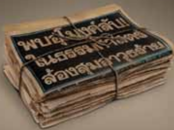
(เอาที่สบายใจเลยที)

ไม่อ่าน..ไม่ได้! เล่มใหม่ล่าสุดวางแผงแล้ว